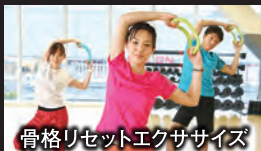
骨格リセットエクササイズ